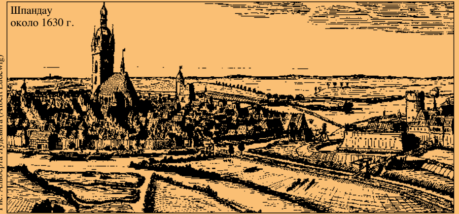
Рис. Альберта Лудевига (Albert Ludewig)

Крепость полностью окружена водой, имеет форму почти равностороннего четырехугольника. Расстояние между шпильми бастионов составляет 300 метров. Можно предположить, что цитадель отвечала идеальным представлениям о крепостях того времени. Крепость являлась пограничным укреплением. Она защищала Берлин – резиденцию правительства, служила убежищем во время войн и являлась также государственной тюрьмой.