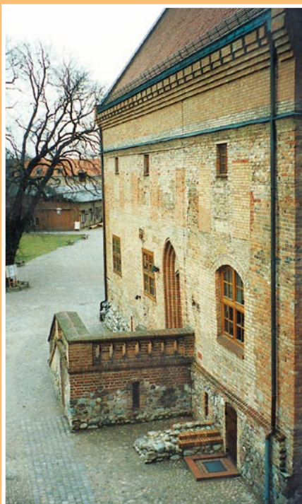
Zdjęcie u góry: Sala zamkowa starego zamku Spandau zbudowanego na resztkach poprzednich budynków z XV wieku, zrekonstruowanego 1979-1982.

1 maja 1945 roku cytadela trafiła bez walki w ręce Armii Czerwonej.