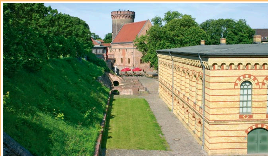
Zdjęcie u dołu: Zbrojownia, budowana od 1856 do 1858, widziana od strony bastionu królewskiego. W głębi pozostałości starego magazynu, który w roku 1813 został zniszczony tak jak sala zamkowa i wieża Juliana.

Po II wojnie światowej twierdza nie była już nigdy więcej używana na potrzeby wojskowe.