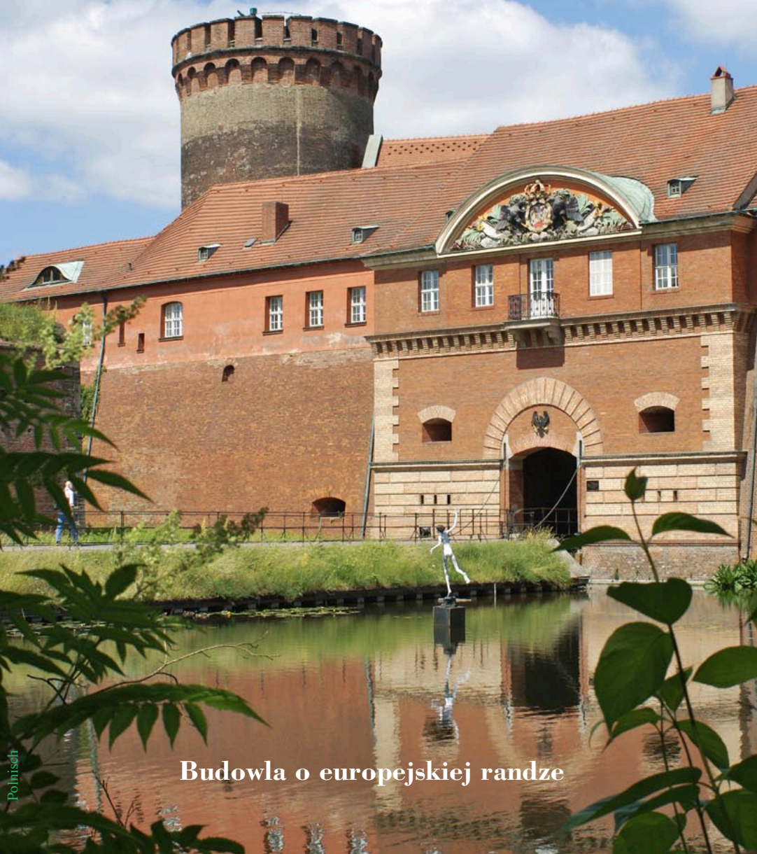
Budowla o europejskiej randze