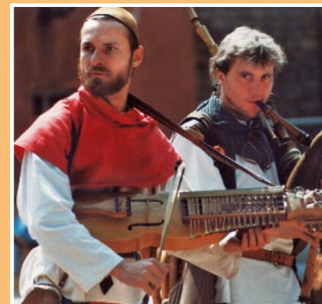
Muzycy z historycznymi instrumentami podczas święta zamkowego.

Od roku 1949 do 1986 w cytadeli znajdowała się szkoła budowlana i od tego czasu zaczęto organizować i prowadzić imprezy kulturalne. Celem berlińskiego senatu i urzędu okręgowego Spandau było urządzenie w historycznym budynku, który sam ma wartość muzeum, centrum kultury i rozrywki. Pierwszym krokiem było otwarcie Historycznego Muzeum Spandau (1992), które umożliwiło innym rozpoczęcie działalności kulturalnej.